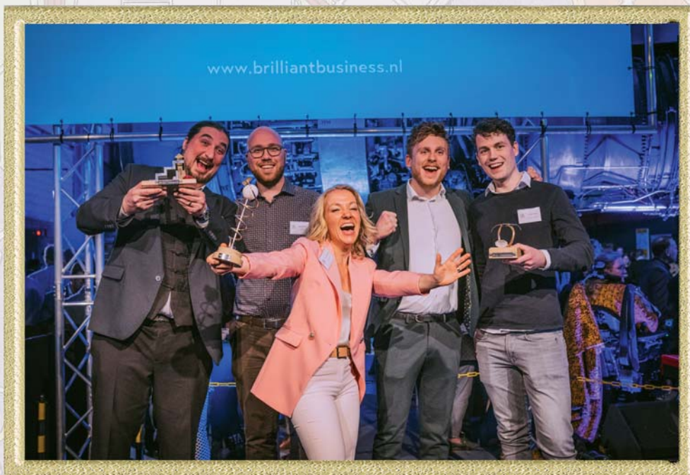
Winnaars Brilliant Business Awards