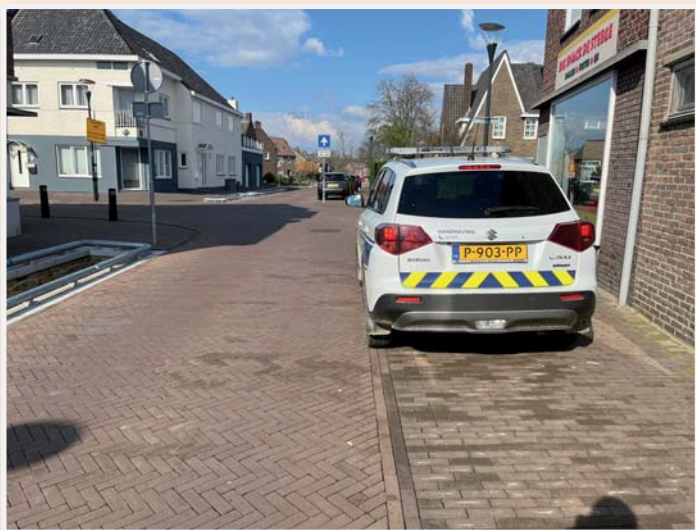
Deze stoep is wel een zogenaamde rabatstrook. Hier mag dus wel geparkeerd worden.

Parkeren op dit stuk stoep is lange tijd toegestaan, omdat men er van uit ging dat het wegdek een zogenoemde rabatstrook is. Dit blijkt echter niet het geval te zijn. Hinkend parkeren op de stoep mag hier dus niet.