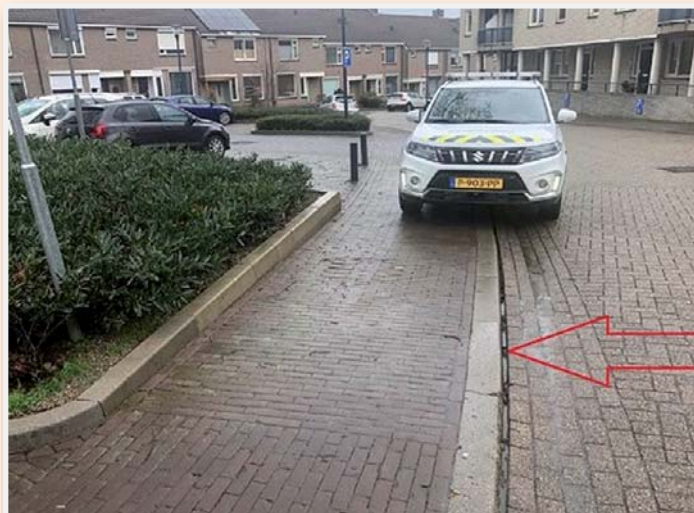
De auto van deze boa's doet het fout parkeren in het Raadhuispark even voor.