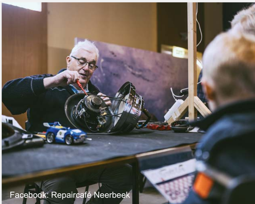
Facebook: Repaircafé Neerbeek

Hoe vaak gebruikt u een boormachine, biertap of partytent? Veel spullen heeft u maar een paar keer per jaar nodig, de rest van de tijd liggen ze te verstoffen op zolder of in de schuur. Deel uw eigen spullen of kijk of u ze kunt lenen van uw vrienden of buurtgenoten. Er zijn steeds meer deel- en ruilplatforms zoals peerby.nl.