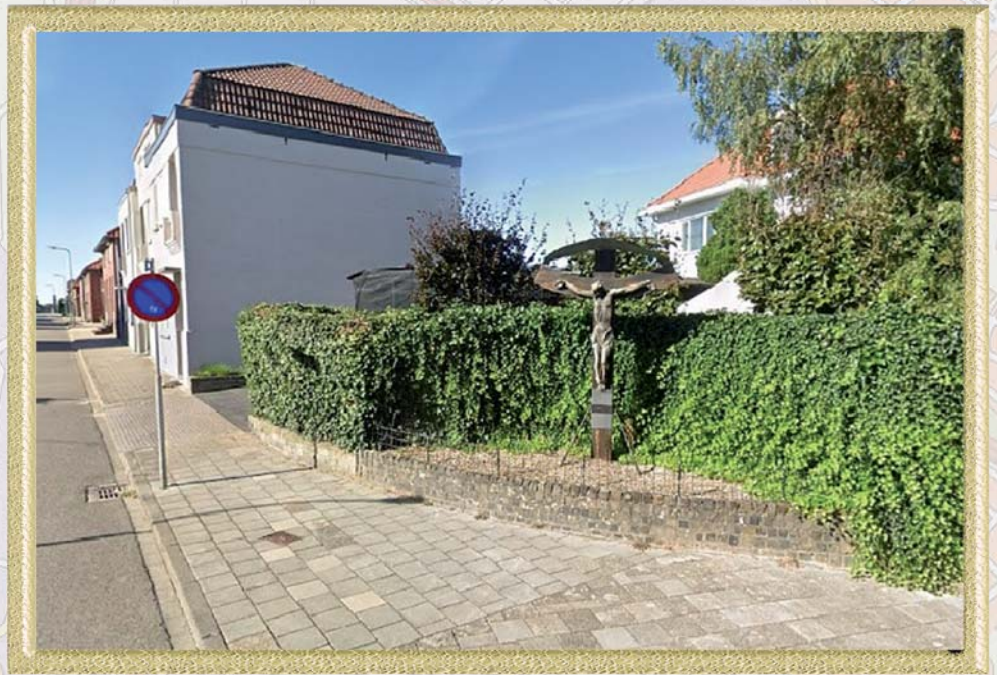
Gouden handen voor Onze Lieve Heer