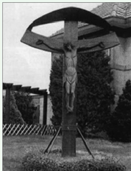
** Becha jg 5 nr. 2 p. 28 (1991)

* boek 'Wegkruisen veldkapellen en andere uitingen van de volksvroomheid in de gemeente Beek', Wat Baek ós bud, deel 3, 1986 (Egelie/van Winkel)