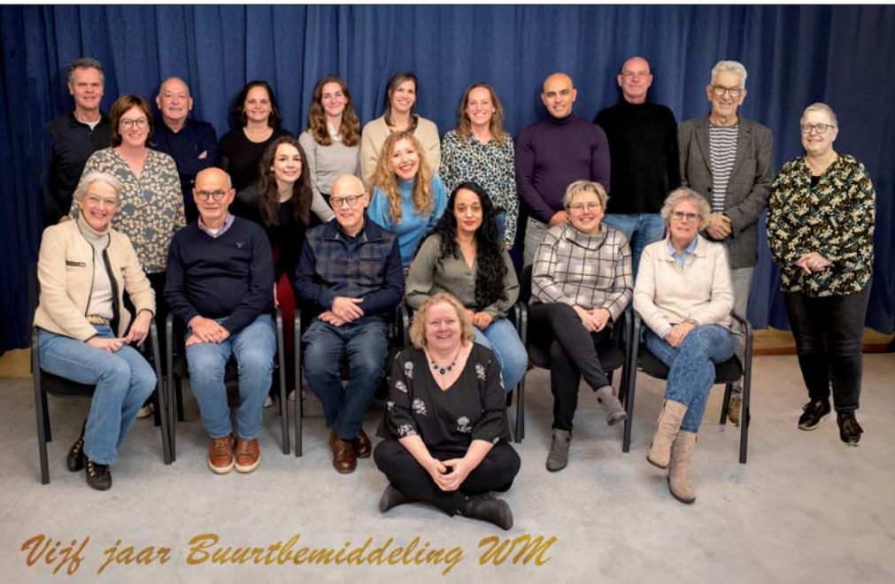
Vijf jaar Buurtbemiddeling WM

Kijk voor meer informatie over Buurtbemiddeling of hoe om te gaan met burenruzies op www.buurtbemiddeling-wm.nl of www.problemenmetjeburen.nl