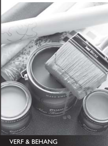
VERF & BEHANG

Deco Home Smeets is dé specialist in verf, behang, gordijnstoffen, raamdecoratie en vloeren. Wij nemen uitgebreid de tijd om samen met u uw wensen te bespreken. We geven u deskundig advies. Samen met onze binnenhuisarchitecte komt u misschien op combinaties waar u zelf nooit aan gedacht hebt. De mogelijkheden zijn zo verrassend veelzijdig. In onze winkel vindt u shop-in-shops voor o.a. de topmerken Sigma, Novilon, Desso, Parade en Luxaflex. Wij zijn ook gespecialiseerd in projectinrichting. Naast interieurinrichting verzorgen wij desgewenst ook uw schilderwerk en gevelverzorging. Kortom, wij zijn van alle markten thuis. Kom langs en laat u inspireren!