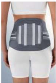
RUG- EN BUIK CORSETTEN