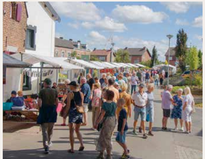
Winandusmarkt Catsop - Catsop, 10.00 - 17.00 u. - 13 September.